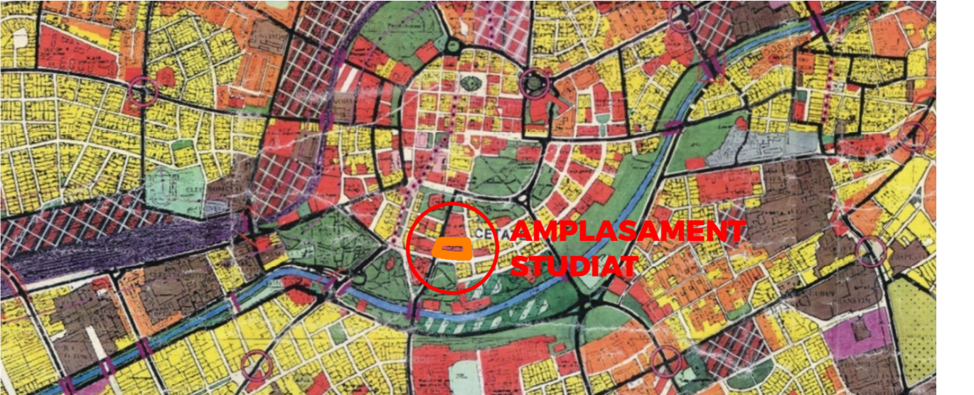
INCADRARE IN P.U.G. IN VIGOARE - ZONIFICAREA TERITORIILOR INTRAVILANE - SCARA 1:25.000